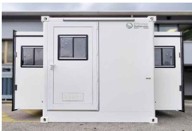
Ansicht in „erweiterter“ Betriebsposition