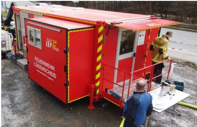
Blick auf den Eingang des Aufenthaltsraums – mit ausgezogenen Seitenkörper