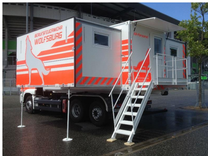
Vista del complessivo sul lato ingresso in operativo (aperto sui due fianchi)