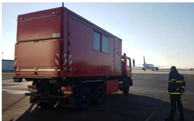
Vista esterna del complesso in formazione di trasporto (chiuso)