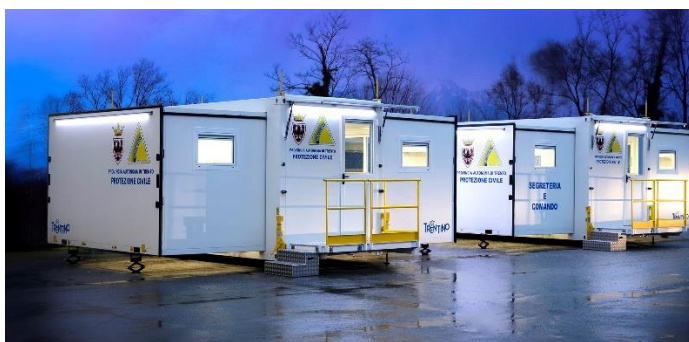
Vista del complesso in operativo posto a terra