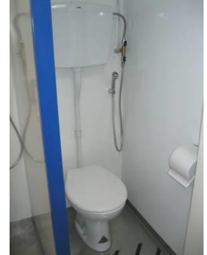
Particolari d'interno: a sx. cabine doccia - ingresso/svincolo con lavabo a dx. - a dx cabine con "vaso standard"