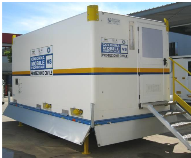
Vista del complesso su angolo posteriore/ingresso e fianco con attacchi/allacciamenti